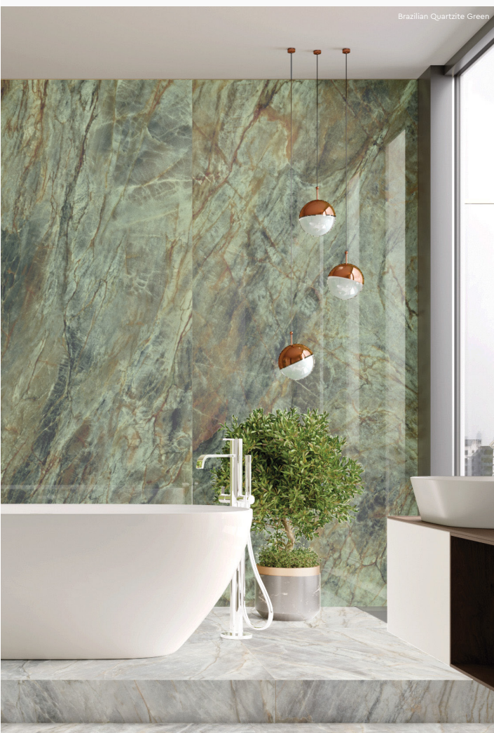
Brazilian Quartzite Green

Características Técnicas / Technical Features