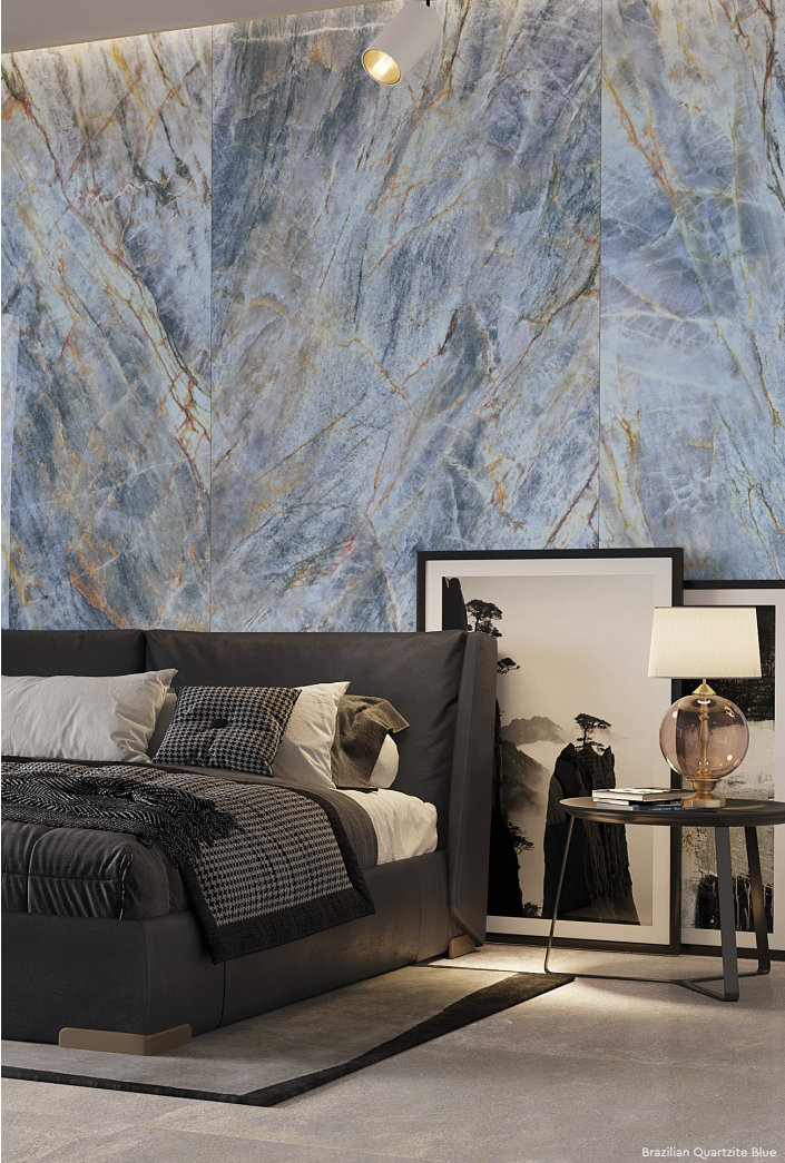
Brazilian Quartzite Blue.